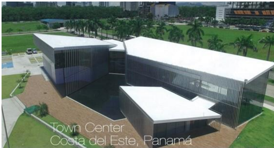
Town Center Costa del Este, Panamá